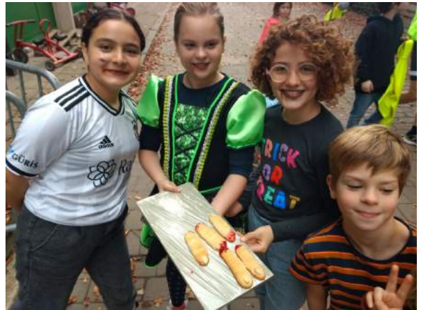
Deze dingen passeerden ook de revue...