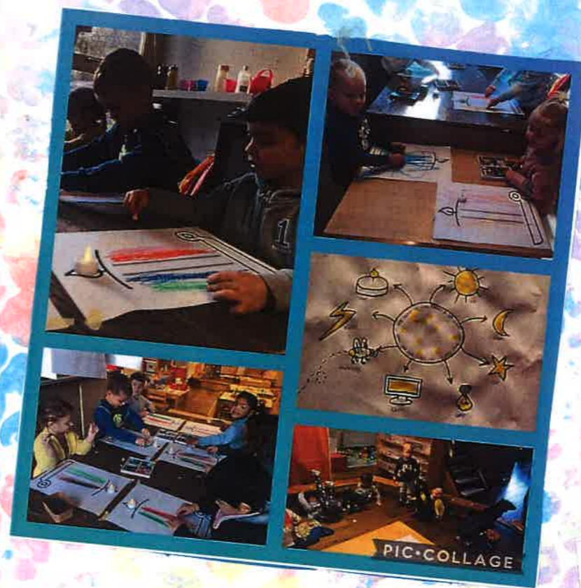
Robbe: Kaarsje make, ikke ook kaarsje maken. Schrijf dans rechte lijnen.

We zorgden dat de dieren die gevangen zaten in het ijs eruit werden geholpen. Daarna werd gespeeld van de Zuidpool en maakten ze eilanden met de stukken ijs.