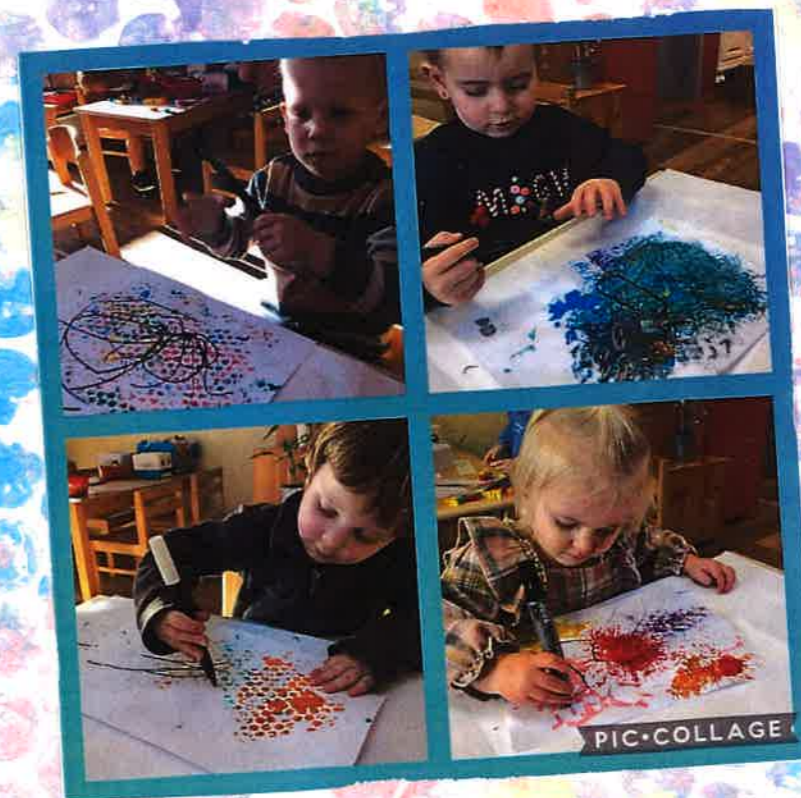
Robbe: Vies doen. We maakten een vrije tekst.