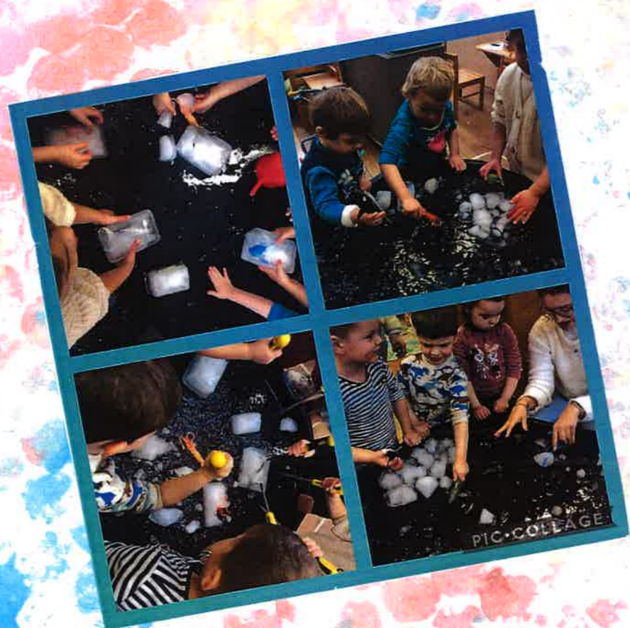
Ijs waren wij aan het doen, zo hard doen.

We zorgden dat de dieren die gevangen zaten in het ijs eruit werden geholpen. Daarna werd gespeeld van de Zuidpool en maakten ze eilanden met de stukken ijs.