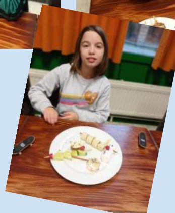
(Per-Olov was er toen helaas niet bij...)